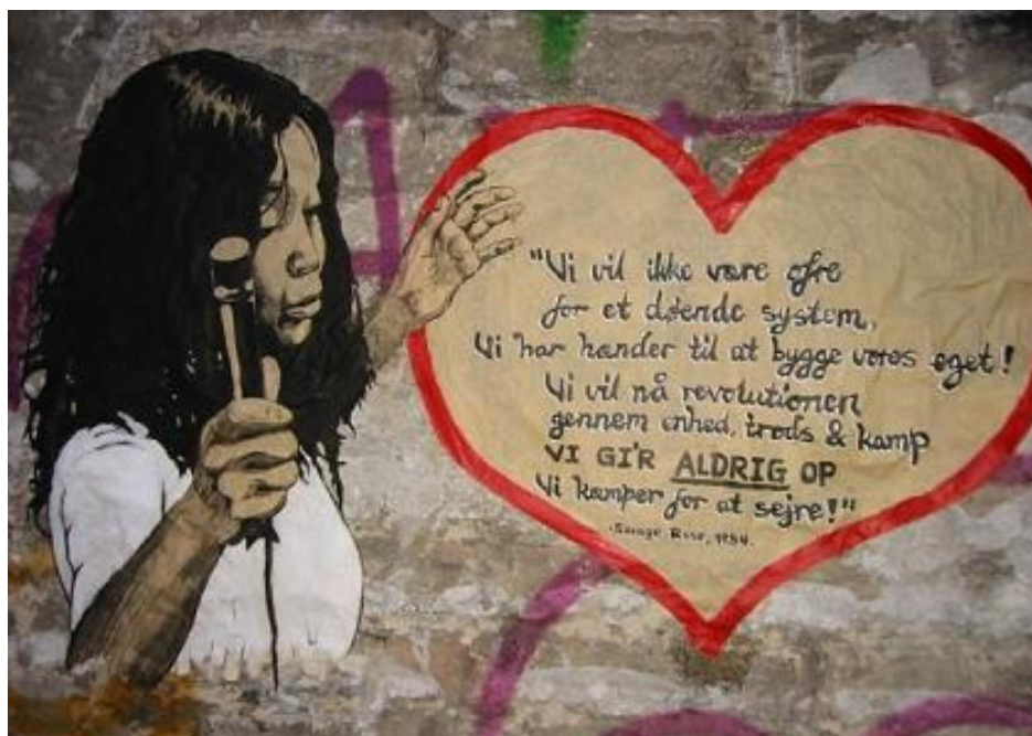
Murmaleri Savage Rose på Ground 69